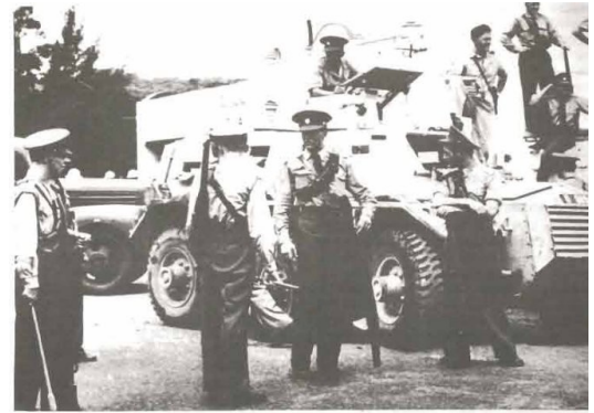
Image de la répression en Afrique du Sud

Jeune homme de l'écrasante majorité noire autochtone d'Afrique du Sud (83 %) tué par la police antiémeute de l'apartheid en 76-77 parce qu'ils protestaient contre l'obligation dans leur ghetto de l'enseignement obligatoirement dans la langue de la minorité blanche afrikaners (17 %), minorité qu'ils n'ont pas le droit de côtoyer (ici).